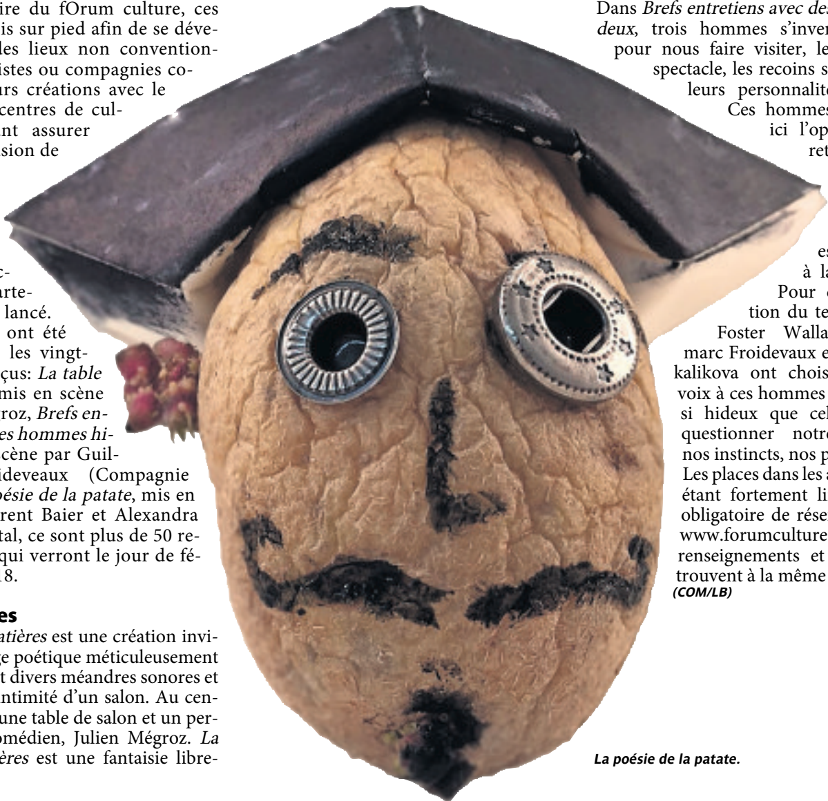
La poésie de la patate.